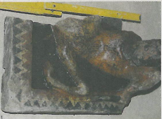
Centaur in hoogrelieff van een tempel in Cerveteri, collectie Princeton University Art Museum.